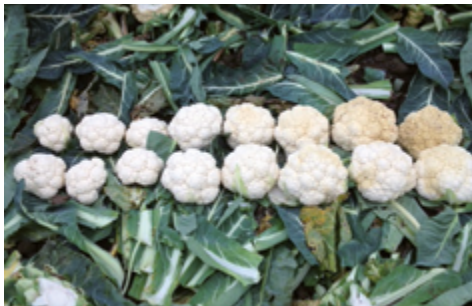
Standardowy program ochrony