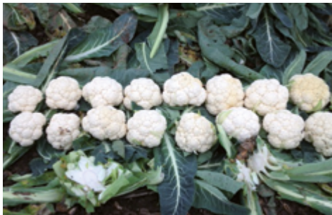
Verimark® ochrona przed szkodnikami

Poniższe zdjęcia z doświadczeń polowych pokazują różnice w jakości towaru wyprodukowanego z użyciem standardowego programu ochrony a programu ochrony bazującego na środkach zawierających substancję czynną Cyazypyr®. Doświadczenia wyraźnie pokazują, że stosowanie środka Verimark® przed wysadzeniem rozsady zdecydowanie wpływa na formowanie jednolitych, wyrównanych plonów spełniających wymagania sieci handlowych.